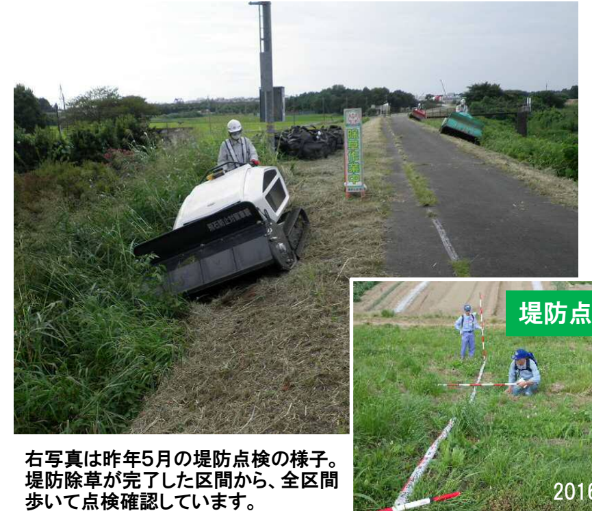
右写真は昨年5月の堤防点検の様子。堤防除草が完了した区間から、全区間歩いて点検確認しています。

工事発注者: 下館河川事務所 鎌庭出張所 TEL:0297-42-2644 工事受注者: 新井土木株式会社 TEL:0297-42-1230